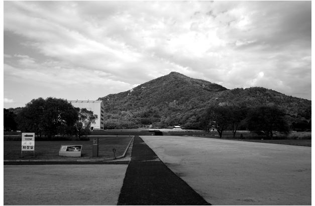
익산 미륵사지와 사자사 (이장웅, 2018)

그러나 智明의 10년은 陳에서 佛法의 진수를 얻은 시간이므로 백제에 머물 여유는 없으며, 17년 동안 계속 陳에 머무르다가 신라로 귀국한 사실이 K와 L의 기록에서 일치하기 때문에 智明과 知命은 별개의 인물이라는 견해도 제기되었다. 81) 필자는 이 의견처럼 신라승 智明이 백제에 머문 적이 없이 陳에 유학했다가 신라로 돌아왔음에 동의한다. 다만 서동 설화 속 백제 무왕 시기의 知命法師는 백제의 승려로 따로 실존했던 인물이 아니라, 신라 승려 지명을 바탕으로 설화 속에서 설정된 인물로 볼 가능성이 크다고 본다.