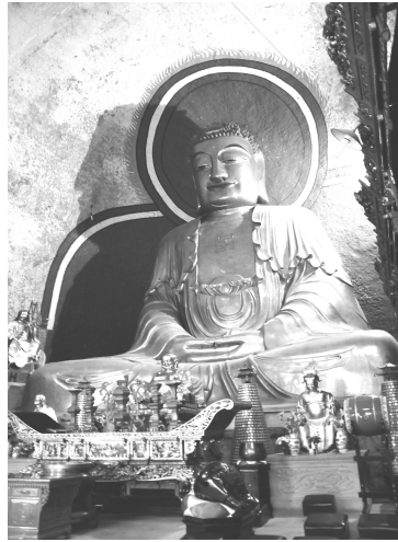
도 2 新昌 大佛寺 彌勒石像. 梁 武帝 516년 창건. 清代重修.

國의 押衙라고 기록되어 있다. 13) 여기에 기록된 신라인 김청은 한반도와 중국의 해상을 왕래하며 활동하면서, 함께 무염선원을 건립한 錢鏐에게 한반도의 정세 변화를 직접적으로 신속하게 알려주었던 인물로 추정된다. 김청의 존재는 당시 중국 강남지역의 실권자로 등장한 錢鏐와 신라계 관리의 직접 교류가 있었음을 알려준다. 14)