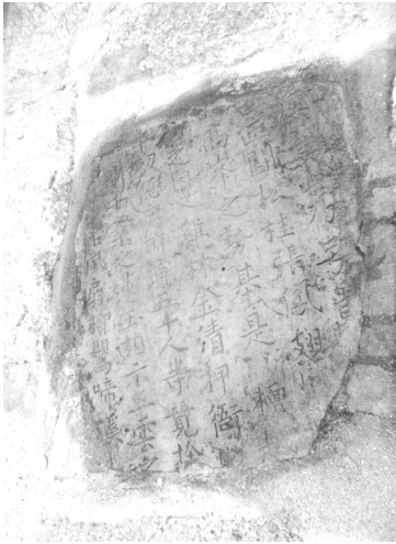
도 1 <唐無染禪院碑> 殘片. 唐 901년. 中國 山東省 無染禪院址.