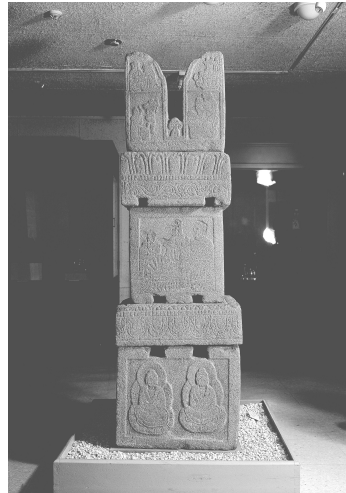
도 4 전 대평리사지 석탑. 고려 11-12세기경. (서울 동국대학교 박물관 소장)