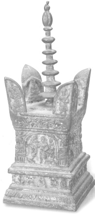
도 3 동제 전홍숙탑. 오월국 955년. 중국 浙江省 崇德縣 崇福寺塔 출토. (중국 杭州 浙江省博物館 소장).