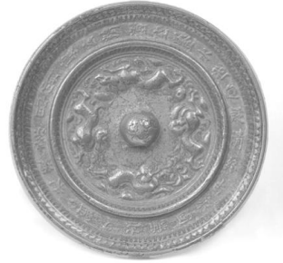
도 6 靑銅四龍文鏡. 고려 10~11세기. 강원도 월정사탑 출토. (평창 월정사성모박물관 소장)

2007년 안동시 普光寺 소장의 고려시대 12세기경의 木造觀音菩薩坐像의 佛腹藏品이 조사되는 과정에서, 새로운 총지사본 보협인경 판본이 발견되었다(도 5). 안동 보광사의 보살상 안에서 불복장품으로 봉안된 보협인경은 가로 45cm, 세로 32cm의 종이 한 장에 2판, 혹은 세 판의 목판을 한꺼번에 찍어 놓은 印本으로, 20여 장이 한꺼번에 발견되었다. 이것은 두루마리 형태로 만들기 전에 종이에 찍은 상태 그대로 봉안한 것으로, 고려 및 조선시대 佛腹藏品으로 흔히 발견되는 紙本陀羅尼 형식이다. 47) 보광사 보살상은 양식으로 볼 때, 12세기 중후반기에 제작된 것으로 알려져 있다. 아마도 이 보협인경은 판각 자체는 총지사본의 목판을 이용해서 찍은 것이지만, 종이에 찍힌 시기는 보살상의 복장을 봉안하던 12세기 중후반기였을 가능성이 크다.