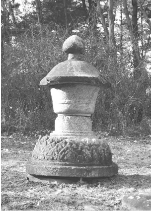
도 7 편운화상부도. 후백제 910년. 남원 실상사.