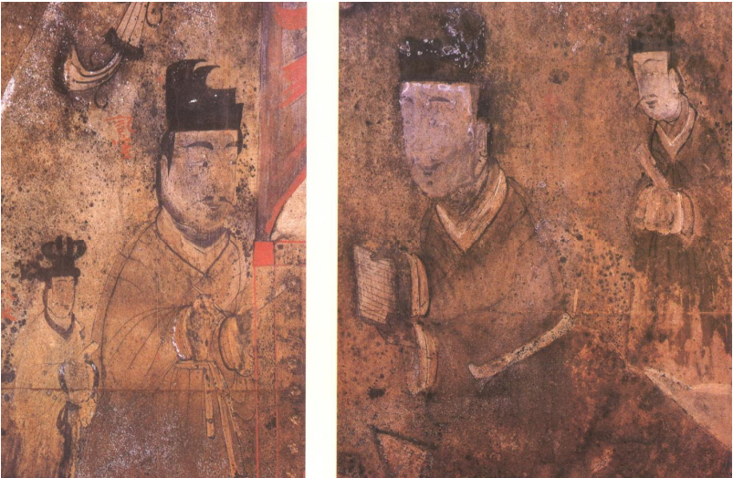
<그림 2> 안악 3호분의 記室과 省事

현재까지 출토되어 알려진 한국의 고대 목간에서는 편철죽간의 존재를 확인할 수 없지만, 편철간의 역사적 경험을 추론하는 근거로 거론되는 것이 4세기 중반 28) 에 축조된 안악 3호분의 고분벽화이다. 안악 3호분의 고분벽화 가운데 政事圖에는 묘주를 가운데에 두고 좌우에 두 사람의 관인이 그려져 있는데, 왼쪽의 관인은 記室, 오른쪽의 관인은 省事라는 職名이 기재되어 있다. 기실은 오른손에 붓을 들고 묘주의 지시나 명령을 적고 있는데, 이 때 왼손에 들고 있는 것이 목간으로 추정된다. 한편 省事는 무릎을 꿇고 앉아서 두 손으로 문서 같은 것을 든 채 보고를 하고 있는 모습이다. 성사의 무릎 앞에는 또 다른 문서도 펼쳐져 있다(<그림 2>).