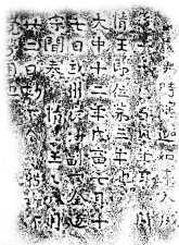
圖 1. 寶林寺 鐵造毘盧遮那佛坐像 造像記