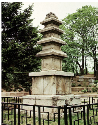
圖 7. 漆谷 淨兜寺址 五層石塔