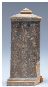
圖 2. 法光寺 三層石塔 石塔記

이러한 배경에는 신라 왕실이 귀족을 포함한 개인의 불사를 철저히 금했던 것에서 기인하는 것으로 판단된다. 9) 다만 855년 文聖王이 조성한 昌林寺 無垢頂光塔 10) 과 景文王이 863년 閔哀王의 추송을 위해