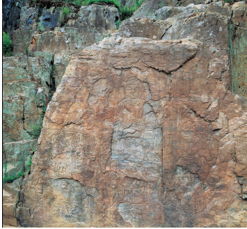
圖 3. 防禦山 磨崖佛

불의 成人인 彌刀乃未는 관장으로 추정된다(E-②). 34) 반면 용봉사 마애불은 승장인 元烏法師가 조성한 것이다(E-③).