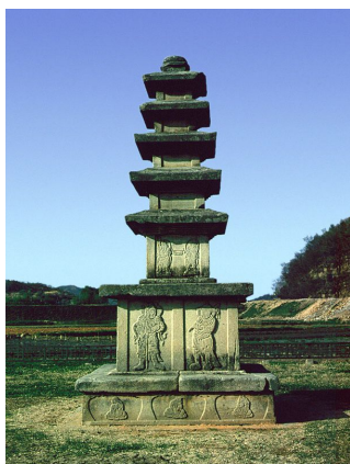
圖 6. 醴泉 開心寺址 五層石塔

숯품 발원의 주체였다고 할 수 있다. 이밖에 漆谷 淨兜寺址 五層石塔 (圖 7) 표면에 새겨진 釋知漢은 形止記에 등장한 戶長層과 수많은 僧俗의 대표자로 명기된 사례로 볼 때, 61) 일부 불교석조미술품에 명기된 보이는 호장은 실질적으로는 郡甸民이 참여하는 ‘거군(현)적 향도 결사’의 대표자로서 명기된 것이라고 할 수 있다. 62)