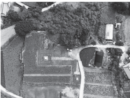
그림 4. 홍법사지

거둔사에 대한 기록은 지종의 하산으로 다시 나타나고 사상적 배경이 법안종으로 바뀐 것으로 보인다. 개경에서만 활약하던 지종이 89세인 1018년(현종 9)에 개경 광명사에서 하산하고 그 해 거둔사에서 입적한 것이 거둔사