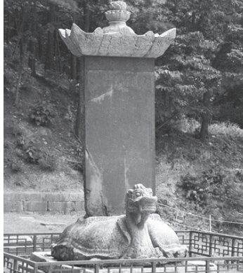
그림 2. 법천사지 지광국사탑 및 탑비