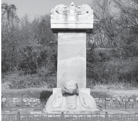
그림 1. 거둔사지 원공국사탑 및 탑비