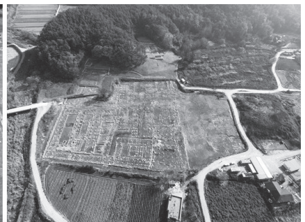
그림 6. 법천사지