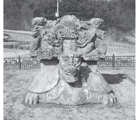
그림 3. 흥법사지 진공대사탑 및 탑비