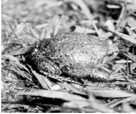
● 맹꽂이 ● ● 천마