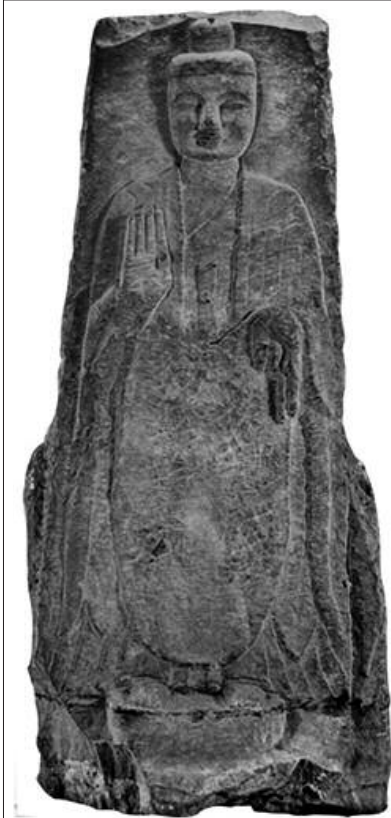
도 3. 남제 茂文 불비상(아미타), 486년, 완형 H 171cm, 성도 사천성박물관