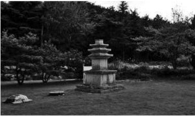
도 17. 감산사 삼층석탑, 719년, 경주시