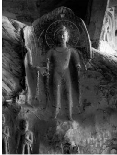
도 16. 불입상, 건흥 5년(424), 난주 병령사 169굴(7굴 북벽)