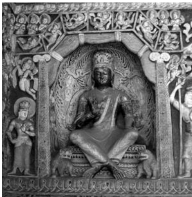
도 9. 운강석굴 9굴 미륵보살상, 북위, ca. 440-534