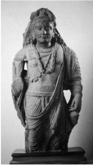
도 7. 미륵보살상, 3C. 간다라