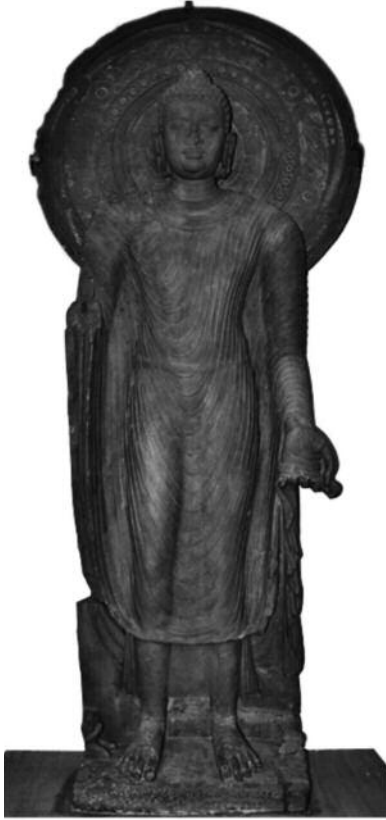
도 15. 인도굽타불상, 마투라박물관