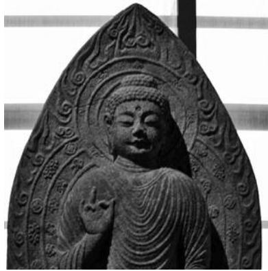
도 14. 감산사 석조 아미타불상 세부