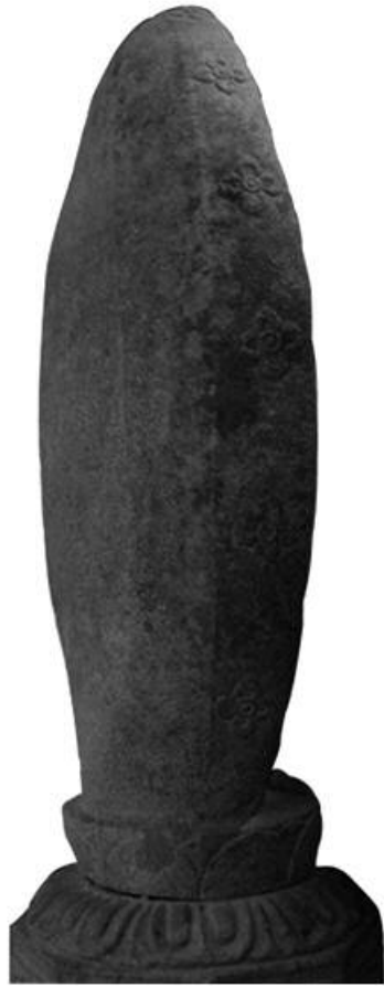
도 18. 감산사 아미타불상 광배 측면