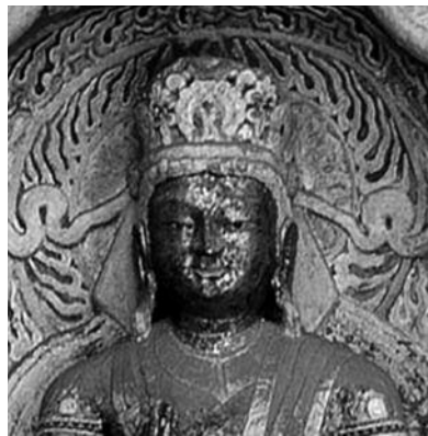
도 10. 운강석굴 9굴 미륵보살상의 세부