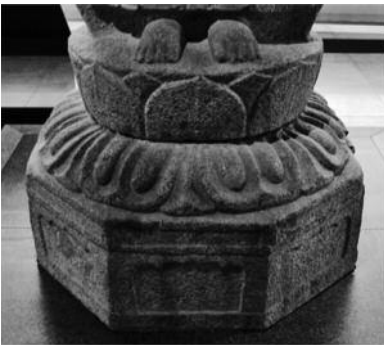
도 13. 감산사 석조 아미타불상 대좌