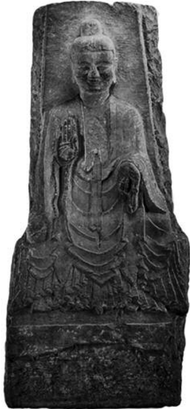
도 4. 남제 茂文 불비상(미륵), 486년, 완형 H 171cm, 성도 사천성박물관