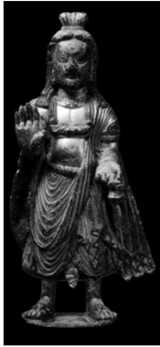
도 8. 미륵보살상, ca 300, 중국 산서성출토, 藤井齋成会有隣館 소장