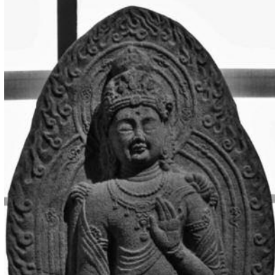
도 12. 감산사 석조 미륵보살상 세부