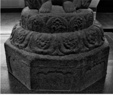
도 11. 감산사 석조 미륵보살상 대좌