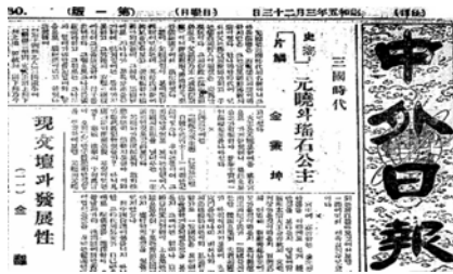
〈사진3〉 元曉와 瑤石公主 42)