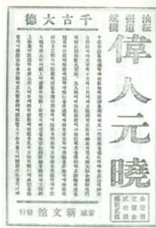
<사진1> 『청춘』11호 『위인원효』광고

<사진1>은 잡지 『청춘(青春)』에 수록된 장도빈(張道斌, 1888~1963)의 『위인원효(偉人元曉)』의 광고이다. 이는 당시 원효에 대한 관심이 지식인들의 교류 및 출판업계를 중심으로 ‘조선학 부흥을 위한 불교학’으로도 전개되었음을 시사한다. 6)