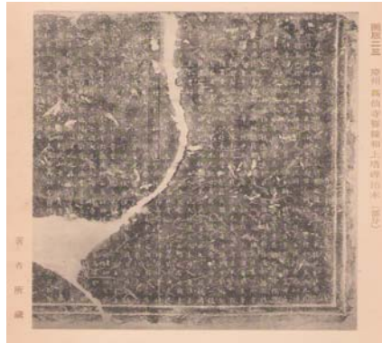
〈사진 2〉 가츠라기 스에지(葛城末治)의 『조선금석고(朝鮮金石攷)』(1931)에 수록된 서당화상비(誓幢和尚碑)사진

가츠라기는 『조선금석고』 이외에 『朝鮮の金石文より觀たる上代の日鮮關係(葛城末治 1936)』에서도 이와 같은 내용을 신고 있는데, 저자는 문화·풍속자료를 바탕으로 고대 일본과 조선의 교류관계를 파악하는 데에 주력하였던 것으로 보인다 27) .