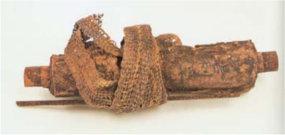
<사진 1> 全身舍利經(月精寺, 12세기 중기)