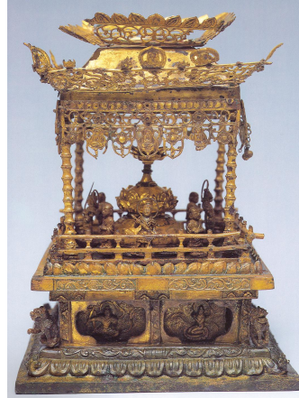
그림 8. 감은사지 동탑사리기