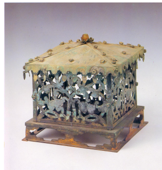
그림 9. 석가탑 금동사리외함