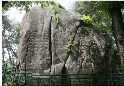
그림 12. 경주 남산 탑곡 마애탑

불탑에 대한 관념의 변화는 7세기 후반 경주 남산 탑곡 마애조상군의 마애탑의 조각들 통해서도 확인된다. 탑곡 마애조상군은 일제강점기 때 ‘神印寺’라는 명문이 새겨진 기와가 발견되어 명랑법사가 개창한 신인종과 관련된 사찰로 추정되고 있다. 39) 탑곡 마애조상군의 북면에는 중앙의 여래상을 중심으