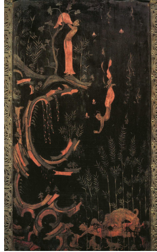
그림 4. 옥충주자 사신사호도

충주자에 장엄되어 있는 회화 가운데 수미좌 우측면의 사신사호도(捨身飼虎圖)는 일찍부터 『금광명경』의 「捨身品」에 의해 그려졌다고 알려져 왔다.[그림 4] 그러나 최근 연구에서는 사신사호도 뿐만 아니라 수미좌정면의 사리공양도(舍利供養圖)와 궁전부 배면의 영축산정토도(靈鷲山淨土圖)도 모두 『금광명경』에 근거하여 그려졌다는 주장이 있어 주목된다. 30)