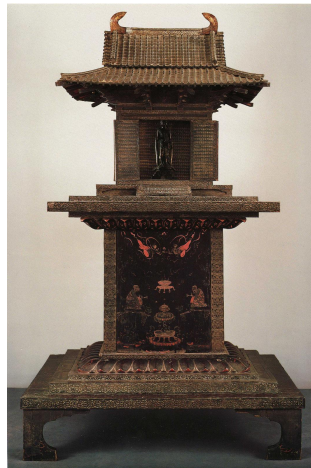
그림 3. 호류지 옥충주자

『금광명경』에서 설한 삼신이 조형화되었을 가능성은 현재 국내에는 금광명경을 소의경전으로 제작되었다고 확신할 수 있는 불교미술품이 남아있지 않아 확신할 수 없다. 그러나 고대 불교미술 자료가 잘 보존되어 있는 일본의 작품 가운데 호류지(法隆寺)에 소장된 옥충주자(玉虫廚子)를 통해 그 가능성을 엿볼 수 있다.[그림 3]