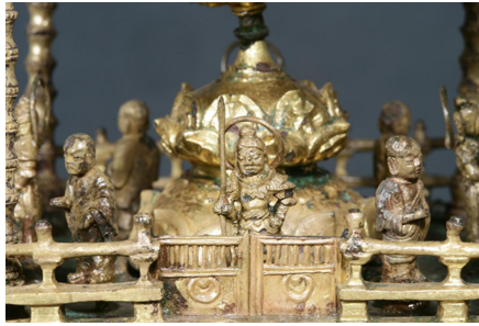
그림 10. 감은사지 동탑 사리기 세부

은사지 쌍탑에서 발견된 사리기이다. 이 가운데 동탑에서 발견된 사리기의 불전부(佛殿部)는 중앙에 놓인 보탑형사리기를 중심으로 사방에 사천왕상과 승상을 배치하여 고대 불전의 내부의 모습을 보여준다.[그림 10] 서탑에서 발견된 사리기와 비교해보면 그 형식은 같지만 [표 1]에서 보듯이 불전부에 배치된 도상과 분위기는 서로 달라 두 탑에 서로 다른 불신관(佛身觀)이 반영되어 있음을 감지할 수 있다. [그림 11]