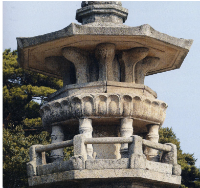
그림 6. 다보탑의 죽절형 석주

성이 크다. 우선 사리의 유무와 관련하여 기존에 사리가 봉안되지 않은 탑이라는 견해와 달리 최근 석가탑에서 발견된 중수문서의 분석을 통해 사리봉안 사실이 밝혀졌다. 33) 그리고 다보탑의 지닌 이형탑(異形塔)으로서의 조형미는 마하살타의 사리를 봉안한 칠보탑(七寶塔)이라는 성격에 부합하는 조형이다. 특히 다보탑의 조형 가