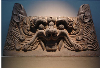
그림 2. 영묘사지 출토 귀면

사에서 출토된 귀면과 조각수법이 유사하여 양지의 작품으로 추정되고 있다. 이처럼 특이한 형식의 귀면와는 그간 출토된 사례가 없어 건물의 어느 위치에 사용되었는지 알 수 없지만 영묘사 목탑에 사용되었던 부재라는 견해가 있다. 19) [그림