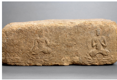
그림 7. 석장사지 탑상문전

쌍탑가람이 본격적으로 조성되기 시작한 7세기 후반의 불교미술품 가운데 그 이전시기와 비교하여 불신관(佛身觀)의 변화가 간취되는 사례로는 먼저 경주 석장사지(錫杖寺址)에서 출토된 탑상문전을 거론할 수 있다.[그림 7] 석장사는 사천왕