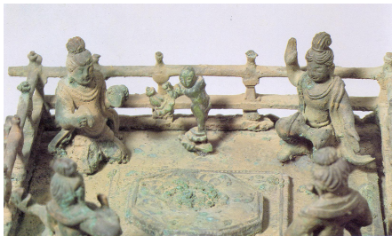
그림 11. 감은사지 서탑 사리기 세부