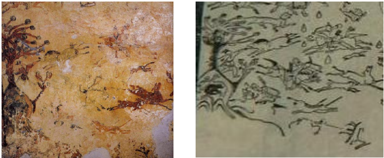
사진 3. 장천1호분에서의 곰과 호랑이

로 그려지고 있음은 동예의 호신 숭배가 5세기 중엽 고구려 사회에서 이미 그 신격을 상실했음을 의미한다고 하겠다. 아울러 이 벽화의 전체 구도에서 곰과 호랑이의 제재가 중심 화면에 위치하지 못하고 하단 왼쪽에 배치된 것 역시 일정한 의미를 부여할 수 있다. 그것은 고구려 건국신화를 의례를 통해 재현하는 것이 동맹이라고 하였을 때, 거기에는 부여를 통해 이어져 온 고조선 건국신화의 내용들이 분명 차용되고 있었을 것이지만, 그 비중은 떨어진 결과를 반영한 것으로 해석된다. 그럼에도 불구하고 장천1호분의 벽화는 고구려의 동맹에 고조선 건국신화의 내용이 일정하게 투영되고 있었음을 보여주는 것이며, 중심 내용이 건국신화의 재현을 통해 여러 구성원들의 결집에 있었고, 그 주재자가 왕이었다는 점에서 고조선→부여→고구려로 이어지는 역사성을 읽어낼 수 있는 자료라고 할 수 있다.