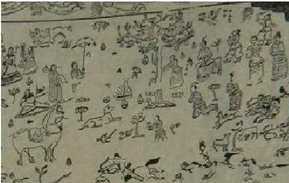
사진 2. 장천1호분 제의 중 수목 숭배

모셨다는 것 역시 수목숭배사상과 관련하여 이해할 수 있다. 그렇다면 고조선의 수목숭배사상은 고구려에 계승되어 동맹제의에서 주요 의례로 구성되었을 것이라는 데까지 논의를 확장할 수 있다.