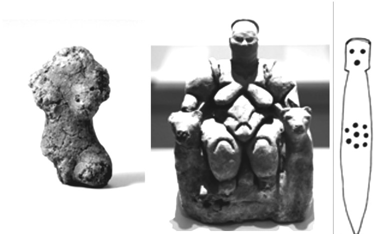
좌로부터 <그림1> 울산 신암리유적 출토 여신상, <그림2> 차탈휘육 신석기유적 출토 여신상(터키), <그림3> 웅기 서포항유적 3기층 출토 여신상 모사선화

서포항유적 3기층 출토 골제 여신상에서 성기가 강조되었다는 사실은 신석기시대에서 청동기시대에 걸쳐 다수 제작되는 한국 암각화 유적의 여성 성기 표현과 연결된다는 점에서 주요한 의미를 지닌다. 울산 천전리 암각화 기하문에는 여성 성기를 표현한 사례들이 다수 보인다(그림4). 7) 천전리 암각화의 기하문 암각은 청동기시대 작품으로 편년된다. 8) 이를 감안하면 청동기시대에 이르면서 생명 출산과 재생의 주체인 여신을 나타내는 방식의 하나로 여성 성기 표현이 선호되었다는 해석도 가능해진다. 9)