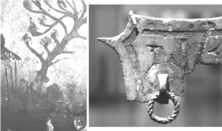
좌로부터 <그림6> 나무 밑동의 곰과 호랑이(각저총, 중국 지안), <그림7> 솟대(농경 문청동기, 국립중앙박물관)

유화는 길게 늘어진 입술을 세 번 자른 뒤에야 말을 할 수 있었고, 갓 태어난 아기 알영은 복천에 씻기고 나서야 입에 붙은 새 부리가 떨어져 울음소리를 낼 수 있었다. 알영은 계룡이 낳았다는 데서 알 수 있듯이 닭 여신이라는 정체성이 또렷이 남아 있었다. 그러나 유화는 하백이 딸의 입술을 잡아 늘어 별주었다는 설명이 알려 주듯이 새 여신이었던가 강의 신 하백의 딸로 변신한 경우이다.