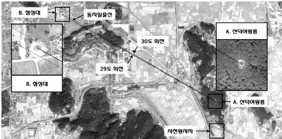
<그림 2> 동지일출선에 정확하게 맞춰진 선덕여왕릉과 첨성대의 위치

넷째, 선덕여왕릉과 첨성대가 동지일출선에 의도적으로 맞춰졌던 것인가의 문제이다. 정확하게 맞춰져 있음은 <그림 2>에서 149) 볼 수 있듯이 부정하기가 현실적으로 불가능하다. 그렇다면 확률은 매우 낮아 보이지만 우연의 결과는 아닐까?