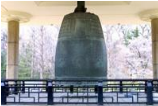
성덕대왕 신종: 국립경주박물관 보관

관계로 종언을 고한 것이나 다름없다. 경덕왕은 불사에 치중해 부처의 공덕으로 천재지변의 재앙을 해결될 것이라 과신하고 무리하게 사찰 창건과 대종(大鐘)의 주조(鑄造)를 강행해 민생경제를 파탄시키는 원인을 제공했다. 그 중 너무나 잘 알려진 신라 경덕왕 때의 부왕인 성덕왕의 위업(偉業)을 추앙(推仰)하기 위해 구리 12만근을 들여 대종을 주조해 성덕대왕신종은 일명 봉덕사종, 에밀레종이라 이른다. 이 종은 종을 만들 때 아기를 시주해 끓는 쇳물에 넣었다는 애뜻한 전설이 있어 흔히 에밀레종이라고도 불려왔다.